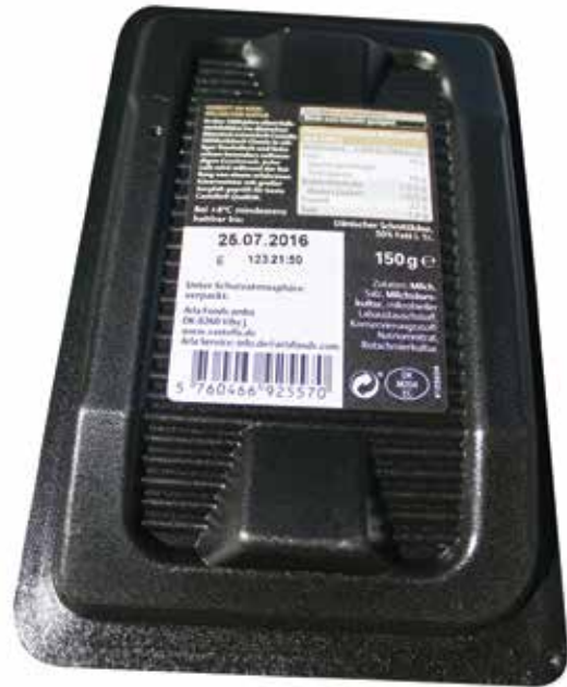
Queijo Fatiado Höhlenkäse®